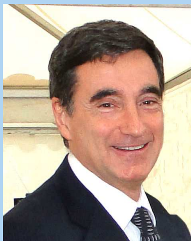
Mr le Président d'ACA2

Rêvons, indignons-nous , nous ont-t'il dit !