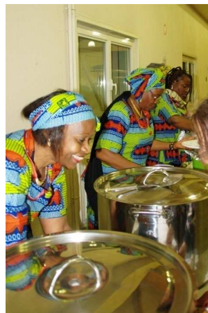
...les dames congolaises arrivent en habit coloré pour servir le repas...