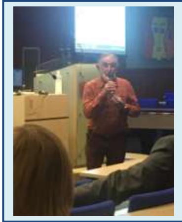
Atelier Lecture Vivante