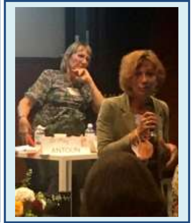
Atelier Matières à rire