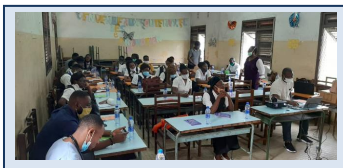
Des étudiants à l'écoute