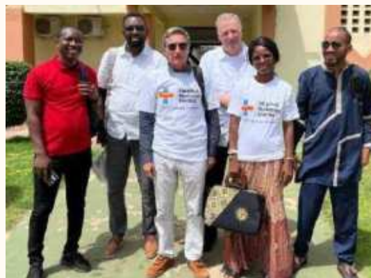
Réunion de travail à l'HND accompagnée par la SOPAG, l'équipe du PNLCC