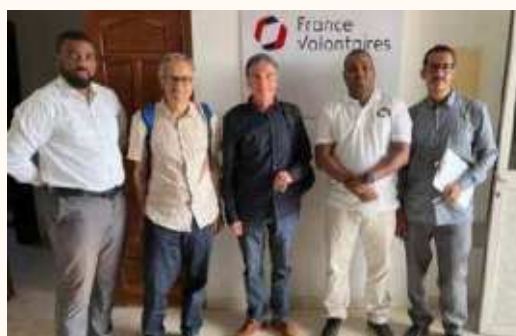
Rencontre plaidoyer avec France Volontaires