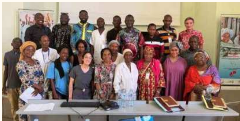
Dernière session de formation à l'HND