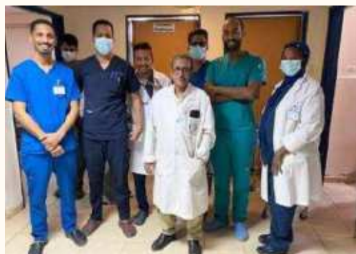
Aperçu d'une équipe du CNO